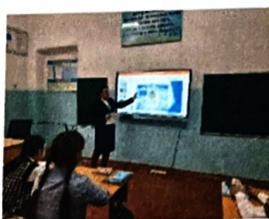
«Действие при угрозе террористического акта»