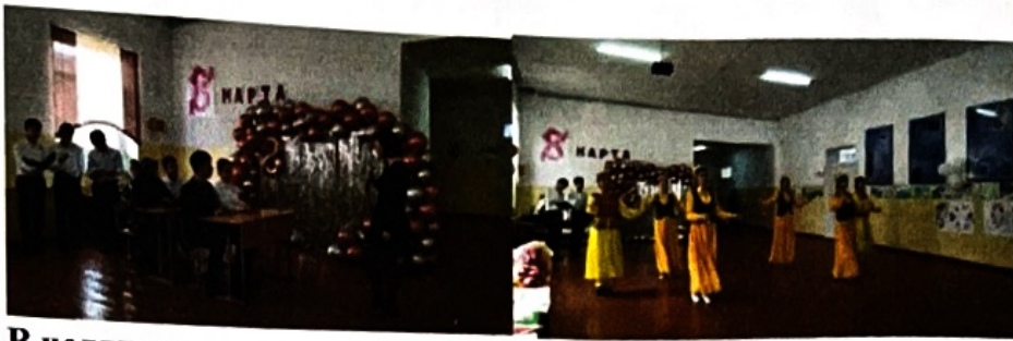
В целях реализации национального воспитания В классах проведены собрания «Украшение девушки- скромность»