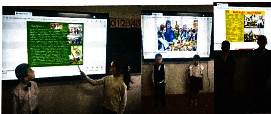
Также в школе прошло мероприятие «Наурыз праздник единства и »