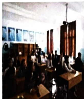
Познавательный урок «Транспортное и подотчетное государство»