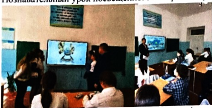
Познавательная акция «Мой флаг, моя Родина!»