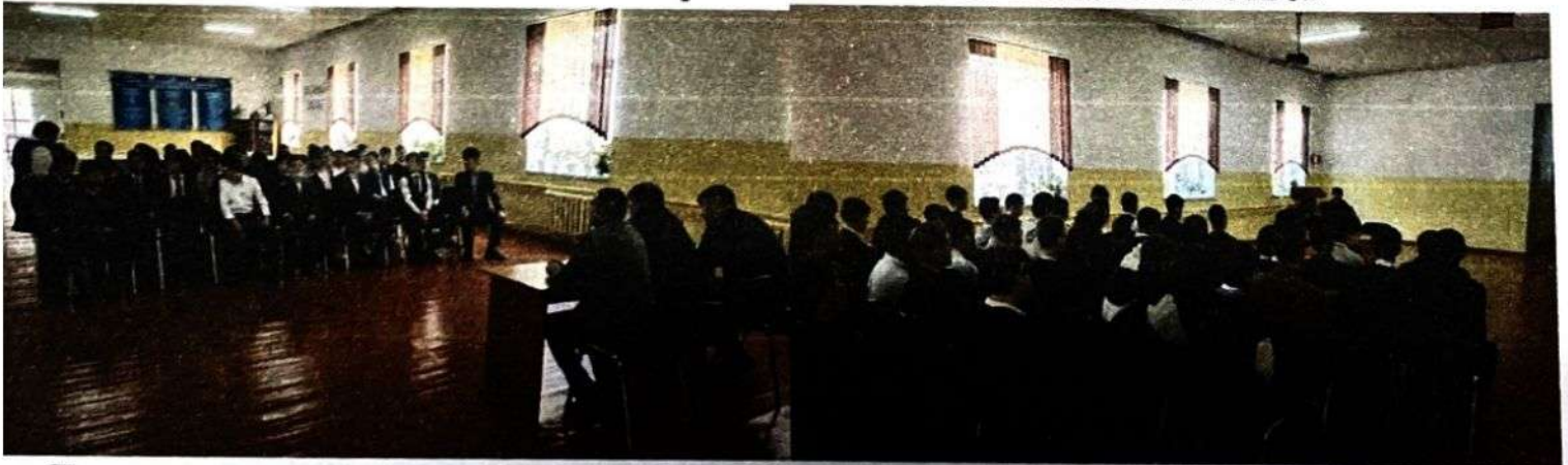
Также проведена индивидуальная работа с детьми группы «риска»