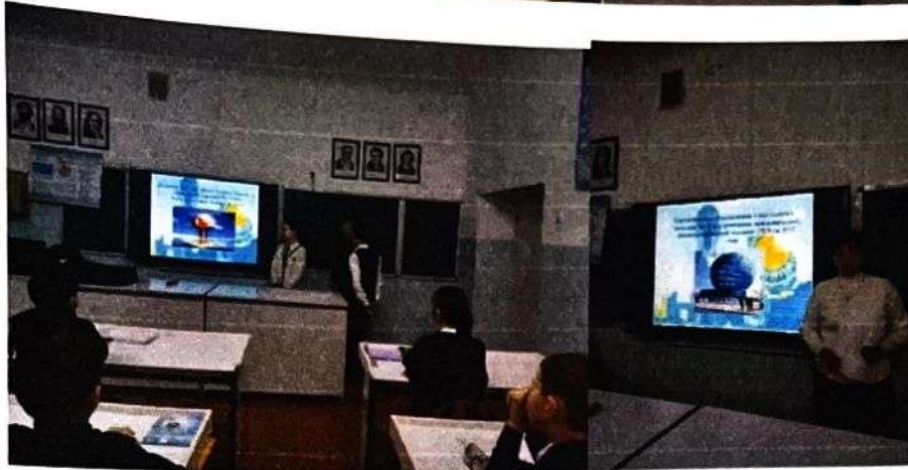
3. Классные часы, посвящённые ТБ на зимних каникулах