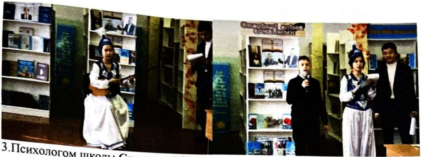
3. Психологом школы Сидоровой Ю.В. проведено анкетирование на предмет употребления наркотических веществ