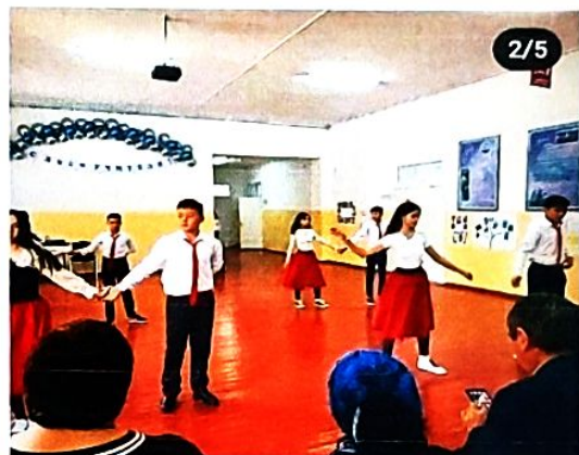
Акция «Поделись теплом души своей» (посещение ветеранов войны, учителей-ветеранов и т.д.);