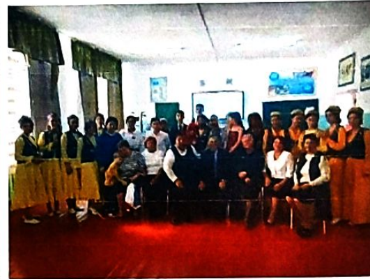
Классный час: «Традиции и обычаи казахского народа»